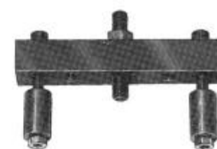
Mothåll monterats på bordet. Art nr 22308