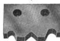
Överskär för fyrkant och runt Art nr 21306